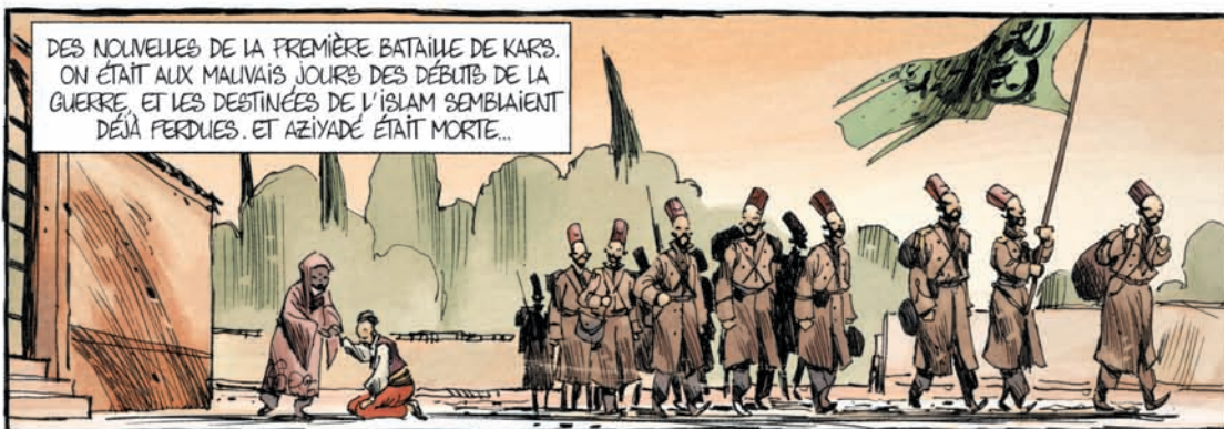
Aziyadé, de Franck Bourgeron, d'après l'œuvre de Pierre Loti, Futuropolis, p.122